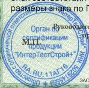
схема сертификации: 4с,

Руководитель (заместитель руководителя) органа по сертификации